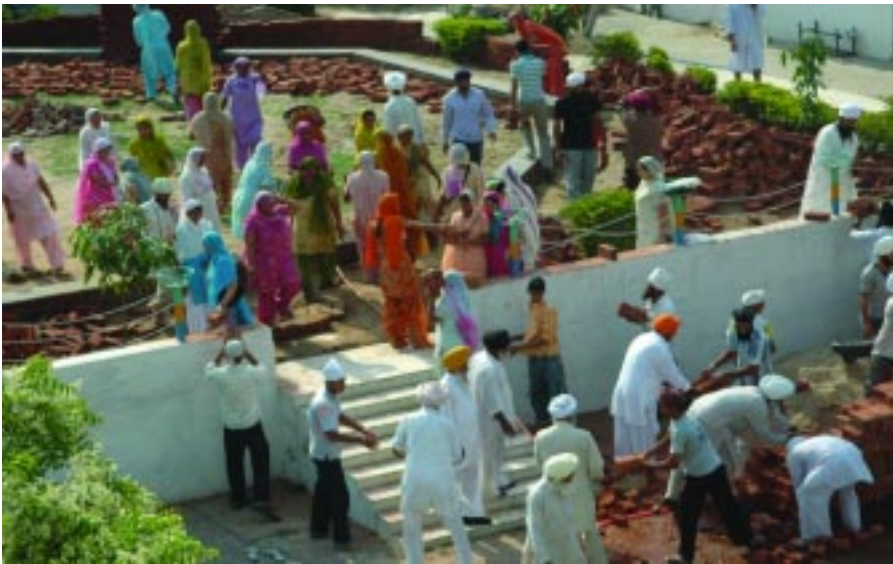
ਮਿਊਜ਼ੀਅਮ ਦੀ ਕਾਰ ਸੇਵਾ ਦਾ ਦ੍ਰਿਸ਼

ਜਦੋਂ ਅਸੀਂ ਉਨ੍ਹਾਂ ਦਾ ਕੋਈ ਲੇਖ ਪੜ੍ਹਦੇ ਹਾਂ ਉਸ ਵਿੱਚ ਨਵੇਂ ਨਵੇਂ ਅਨੁਭਵ ਸਾਨੂੰ ਪ੍ਰਾਪਤ ਹੁੰਦੇ ਰਹਿੰਦੇ ਹਨ। ਇਸ ਕਰਕੇ ਸਾਡਾ ਵੀ ਕੋਈ ਉਨ੍ਹਾਂ ਪ੍ਰਤੀ ਫਰਜ ਬਣਦਾ ਹੈ ਕਿ ਇਸ ਨਿਰੋਲ ਧੰਨ ਧੰਨ ਸਾਹਿਬ ਸ੍ਰੀ ਗੁਰੂ ਗ੍ਰੰਥ ਸਾਹਿਬ ਜੀ ਦੇ ਸਿਧਾਂਤਾਂ ਤੇ ਅਧਾਰਿਤ ਮੈਸੇਜ (ਸੁਨੇਹੇ) ਨੂੰ ਅਸੀਂ ਘਰ ਘਰ ਪਹੁੰਚਾਈਏ। ਤਾਂ ਜੋ ਮਹਾਂਪੁਰਖਾਂ ਦੇ ਇਸ ਪਵਿੱਤਰ ਸੰਦੇਸ਼ ਨੂੰ ਪੜ੍ਹ ਕੇ ਇਸ ਜਲਦੇ ਬਲਦੇ ਸੰਸਾਰ ਵਿੱਚ ਸ਼ਾਂਤੀ