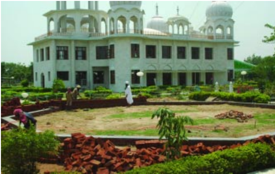
ਮਿਊਜ਼ੀਅਮ ਕਾਰ ਦੀ ਸੇਵਾ ਦਾ ਦ੍ਰਿਸ਼।

ਮਨੁੱਖ ਇਸ ਦੇ ਵਹਿਣ ਵਿੱਚ ਜਲਦੀ ਹੀ ਵਹਿ ਜਾਂਦਾ ਹੈ। ਸਬਰ ਦੀ ਘਾਟ ਹੋਣ ਕਰਕੇ ਲੋਭੀ ਮਨੁੱਖ, ਜਿਸਦੀ ਬਿਰਤੀ ਗੁਰਬਾਣੀ ਨੇ ਹਲਕਾਏ ਕੁੱਤੇ ਵਰਗੀ ਬਿਆਨ ਕੀਤੀ ਹੈ, ਥਾਂ ਥਾਂ ਭਟਕਦਾ ਫਿਰਦਾ ਹੈ। ਇਸ ਭਟਕਣ ਦਾ ਕਿਤੇ ਵੀ ਅੰਤ ਨਹੀਂ ਹੁੰਦਾ। ਤ੍ਰਿਸ਼ਨਾ ਇਤਨਾ ਪ੍ਰਬਲ ਰੂਪ ਧਾਰਨ ਕਰ ਚੁਕੀ ਹੈ ਕਿ ਮਨੁੱਖ ਦੀ ਜ਼ਿੰਦਗੀ ਦਾ ਸਹੀ ਮਨੋਰਥ ਗੁਆਚ ਗਿਆ ਹੈ।