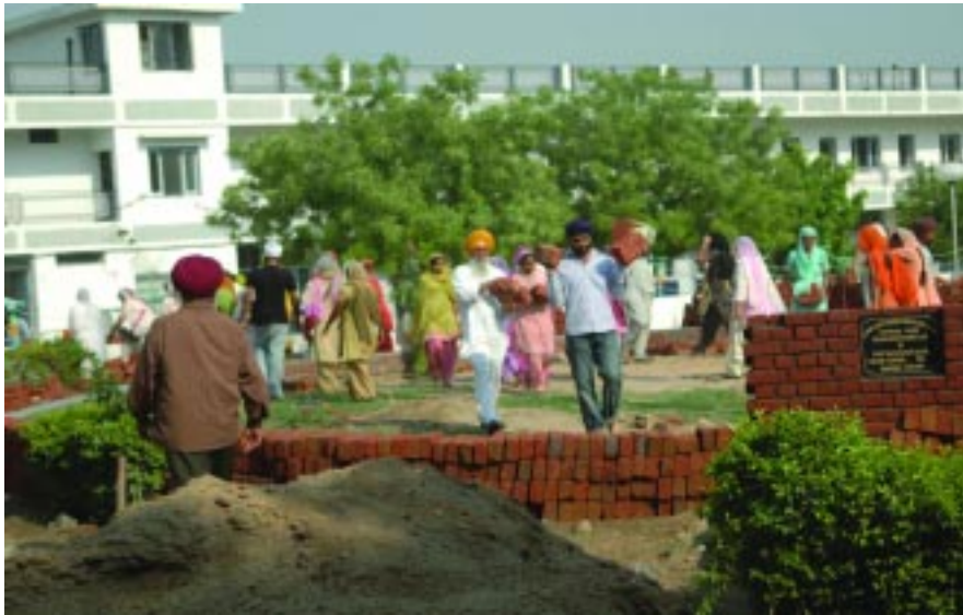
ਮਿਊਜ਼ੀਅਮ ਕਾਰ ਦੀ ਸੇਵਾ ਦਾ ਦ੍ਰਿਸ਼।