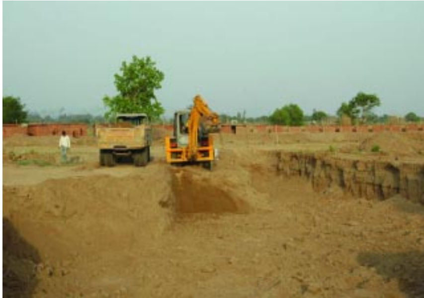
ਸੰਤ ਵਰਿਆਮ ਸਿੰਘ ਮੈਮੋਰੀਅਲ ਪਬਲਿਕ ਸਕੂਲ ਦੀ ਨਵੀਂ ਬਿਲਡਿੰਗ ਦੀ ਕਾਰਸੇਵਾ ਦੇ

ਪਿਛਲੇ 14 ਸਾਲ ਤੋਂ ਇਹ ਤਜਰਬਾ ਇਤਨਾ ਸਫਲ ਸਾਬਤ ਹੋ ਰਿਹਾ ਹੈ ਕਿ ਇਸ ਦੇ ਅਧਿਆਤਮਕ ਲੇਖਾਂ ਦੁਆਰਾ ਲੋਕਾਂ ਅੰਦਰ ਇਕ ਐਸੀ ਧਾਰਮਿਕ ਜਾਗ੍ਰਤੀ ਆਈ ਜਿਸਨੇ ਸਭ ਜਾਤਾਂ, ਵਰਨਾਂ, ਮਜ਼ਹਬਾਂ ਤੇ ਫਿਰਕਿਆਂ ਦੇ ਲੋਕਾਂ ਅੰਦਰ ਇਕ ਤੜਪ ਪੈਦਾ ਕਰ ਦਿਤੀ ਹੈ ਕਿ ਮਨੁੱਖ ਦੇ ਅੰਦਰ ਜੋ ਪ੍ਰਭੂ ਅੰਸ ਹੈ, ਨੂੰ ਖੋਜਿਆ ਜਾਵੇ। ਇਹੀ ਅਸਲ ਵਿਚ ਮਨੁੱਖੀ ਜੀਵਨ ਦਾ ਮਨੋਰਥ ਹੈ। ਇਸ ਮੈਗਜ਼ੀਨ ਦੀ ਦਿਨ-ਬ-ਦਿਨ ਵਧਦੀ ਮੰਗ ਨੇ ਇਹ ਵੀ ਸਾਬਤ ਕਰ ਦਿਤਾ ਹੈ ਕਿ ਮਨੁੱਖੀ ਆਤਮਾ ਨੂੰ ਮਹਾਂਪੁਰਸ਼, ਤੱਤ ਵੇਤਾ ਮੁੜ ਗੁਰਬਾਣੀ ਦੇ ਅਸਲ ਪ੍ਰਚਾਰ ਦੁਆਰਾ ਜਗਾ ਸਕਦੇ ਹਨ ਪ੍ਰੰਤੂ ਸ਼ਰਤ ਇਹ ਹੈ ਕਿ ਜਗਾਉਣ ਵਾਲਾ ਮਹਾਂਪੁਰਸ਼, ਜੋ ਉਪਦੇਸ਼ ਕਰਦਾ ਹੈ, ਉਹ ਆਪਣੇ ਨਿੱਜੀ ਅਨੁਭਵ ਉਤੇ