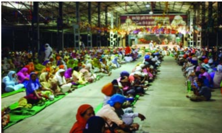
ਸੰਗਤਾਂ ਨੂੰ ਪੂਰਨਮਾਸੀ ਦੀ ਰਾਤ ਨੂੰ ਰਤਵਾੜਾ ਸਾਹਿਬ ਵਿਖੇ ਚੰਦਰਮਾਂ ਦੀਆਂ ਕਿਰਨਾਂ ਵਿੱਚ ਤਿਆਰ ਖੀਰ ਵਰਤਾਉਣ ਦਾ ਦ੍ਰਿਸ਼।