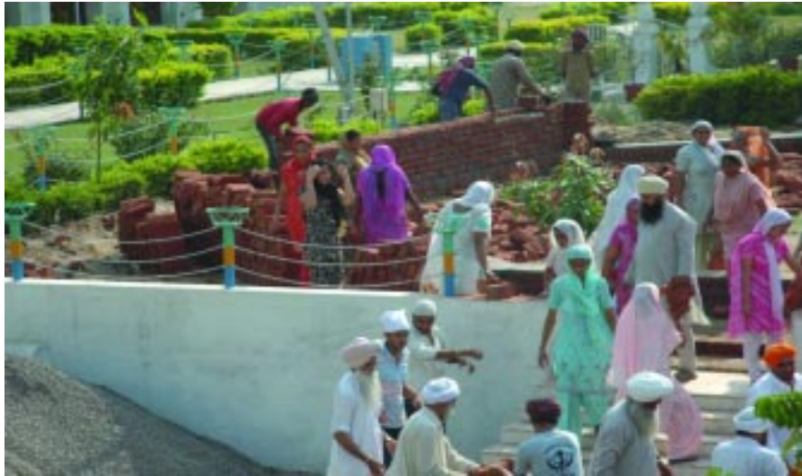
ਮਹਾਂਪੁਰਖਾਂ ਦੀਆਂ ਪਵਿੱਤਰ ਯਾਦਾਂ ਸੰਭਾਲਣ ਵਾਸਤੇ ਬਣਨ ਜਾ ਰਹੇ ਮਿਊਜ਼ੀਅਮ ਦੀ ਕਾਰਸੇਵਾ ਦਾ ਦ੍ਰਿਸ਼।

ਇਹ ਇਕ ਬਹੁਤ ਵੱਡੀ ਵਿਲੱਖਣ ਦੇਣ ਦਿਤੀ ਆਤਮ ਮਾਰਗ ਮੈਗਜ਼ੀਨ ਦੇ ਲਈ ਆਪ ਨੇ ਹਜ਼ਾਰਾਂ ਆਡੀਓ ਵੀਡੀਓ ਕੈਸਟਾਂ ਰਿਕਾਰਡ ਕਰਵਾ ਕੇ ਸੰਸਥਾ ਵਿੱਚ ਰਖਵਾ ਦਿਤੀਆਂ ਤਾਂ ਜੋ ਆਉਣ ਵਾਲੇ ਸਮੇਂ ਅੰਦਰ ਆਤਮ ਮਾਰਗ ਮੈਗਜ਼ੀਨ ਵਿੱਚ ਮੈਟਰ ਦੀ ਕੋਈ ਘਾਟ ਨਾ ਮਹਿਸੂਸ ਹੋ ਸਕੇ। ਆਉਣ ਵਾਲੇ 100 ਸਾਲਾਂ ਤੱਕ ਇਸ ਮੈਗਜ਼ੀਨ ਵਿੱਚ ਜੋ ਵੀ ਮੈਟਰ ਛਪੇਗਾ ਉਹ ਨਵਾਂ ਹੀ ਹੋਵੇਗਾ।