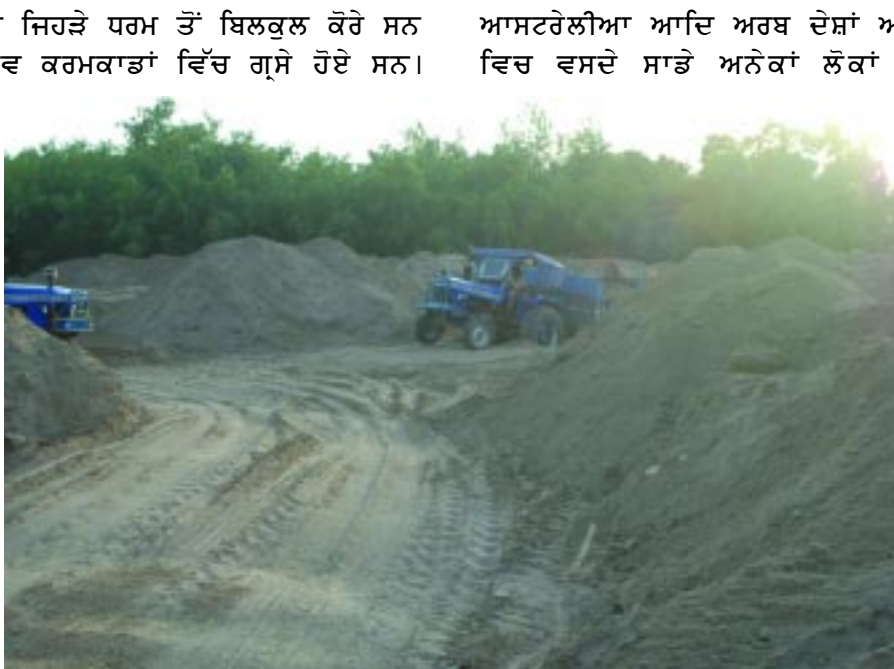
ਆਈ.ਟੀ. ਕਾਲਜ ਦੀ ਬਿਲਡਿੰਗ ਉਸਾਰੀ ਦਾ ਕਾਰਸੇਵਾ ਦ੍ਰਿਸ਼।