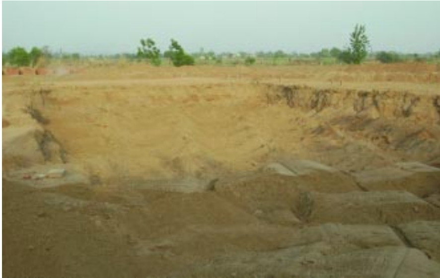
ਆਈ.ਟੀ. ਕਾਲਜ ਦੀ ਬਿਲਡਿੰਗ ਉਸਾਰੀ ਦਾ ਕਾਰਸੇਵਾ ਦ੍ਰਿਸ਼।

ਇਹ ਮੈਗਜ਼ੀਨ ਆਪਣੇ ਅਧਿਆਤਮ ਤੱਤਾਂ ਦੇ ਸਹਾਰੇ ਭਾਰਤਵਰਸ਼, ਪੰਜਾਬ, ਦਿੱਲੀ, ਯੂ.ਪੀ., ਮੱਧ ਪ੍ਰਦੇਸ਼,