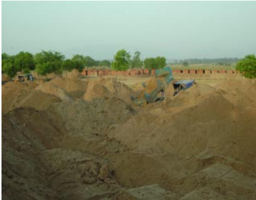
ਸੰਤ ਵਰਿਆਮ ਸਿੰਘ ਮੈਮੋਰੀਅਲ ਪਬਲਿਕ ਸਕੂਲ ਦੀ ਨਵੀਂ ਬਿਲਡਿੰਗ ਦੀ ਕਾਰਸੇਵਾ ਦੇ ਦ੍ਰਿਸ਼।